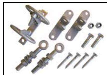
Vnr. 59032: Komplette beslagpakke.

Til teleskopgrindene fås en komplett beslagpakke med kraftige 20 mm justerbare hengsler og stabler. Et Sikkerhets klipfall med beskyttelsesbøyer er inkludert i beslagpakken.