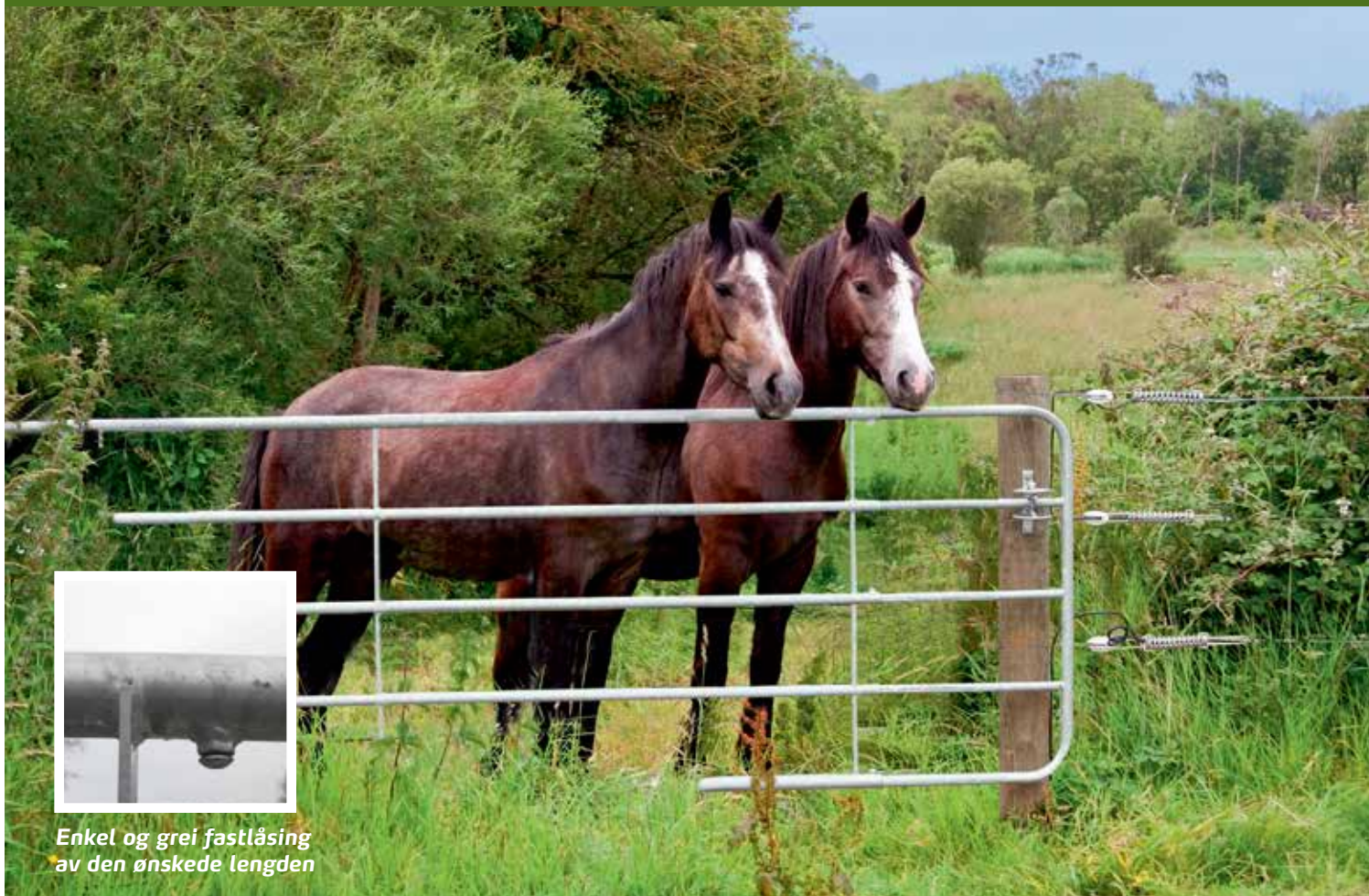
Enkel og grei fastlåsing av den ønskede lengden