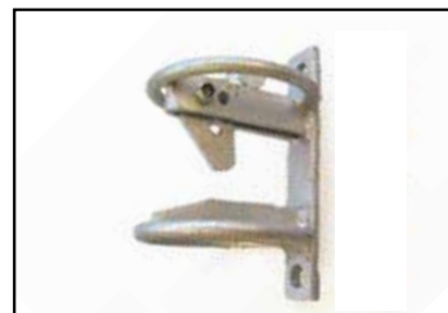
Sikkerhets klipfall. De runde bøyer reduserer risikoen for skader på dyrene.

Med forbehold om produktendringer og trykkfeil.