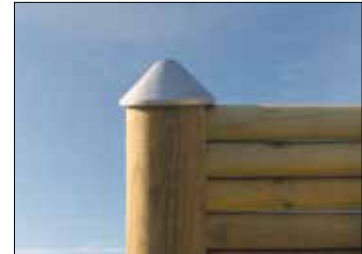
Stolpene kan beskyttes med dekorative alutopper.